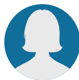
Lea Schulte Altstadtmanagement Neviges

Sie haben noch allgemeine Rückfragen? Gerne können Sie sich an die folgenden Ansprechpartnerinnen wenden: